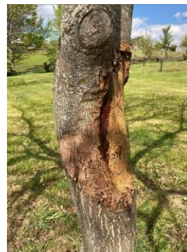
Chancre cureté avec bourrelet de cicatrisation en périphérie