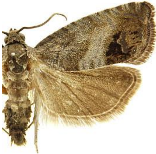
Adulte mâle de Cydia splendana (carpocapse) →