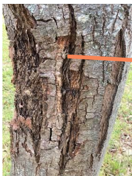
Chancre sur tronc