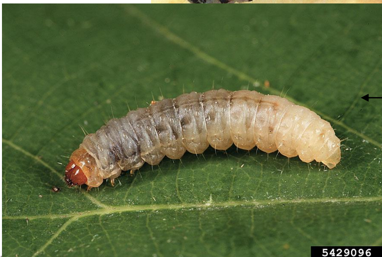
← Larve de Cydia splendana