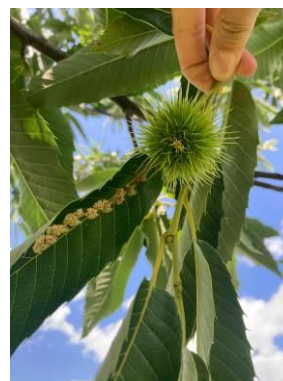
Bouche de Bétizac