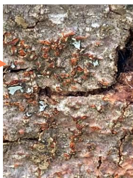
Pustules rouge-orangées : fructifications du champignon