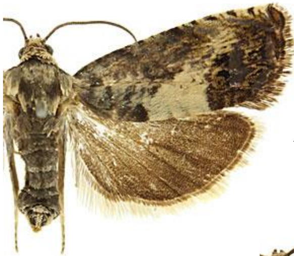
← Adulte mâle de Pammene fasciana (tordeuse)